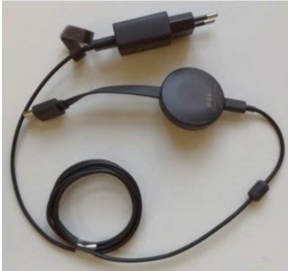
Chromecast 2 med strømforsyning.

Hvordan fungerer Chromecast – og hvad er det egentlig?