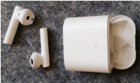
Mi True Wireless Earphones 2S.

Trådløse høretelefoner (eller hovedtelefoner) er populære, og det gælder især Apples AirPods, der – selvom de er relativt dyre – er de mest solgte. Der findes også et væld af lookalikes fra mere eller mindre ukendte producenter.